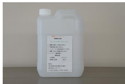
2kg (約 20 m 2 分)