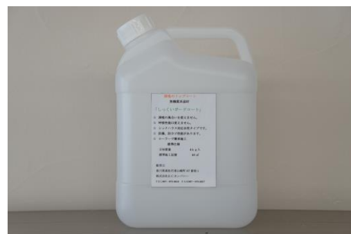
4kg (約 40 m 2 分)